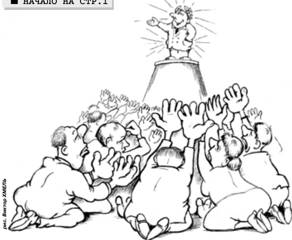
рис. Виктор ХМЕЛЬ